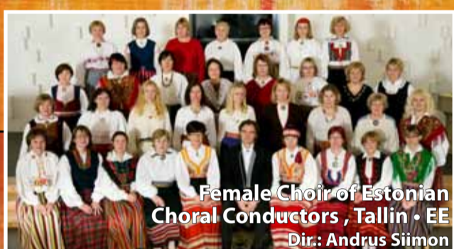
Female Choir of Estonian Choral Conductors, Tallin • EE Dir.: Andrus Siimon