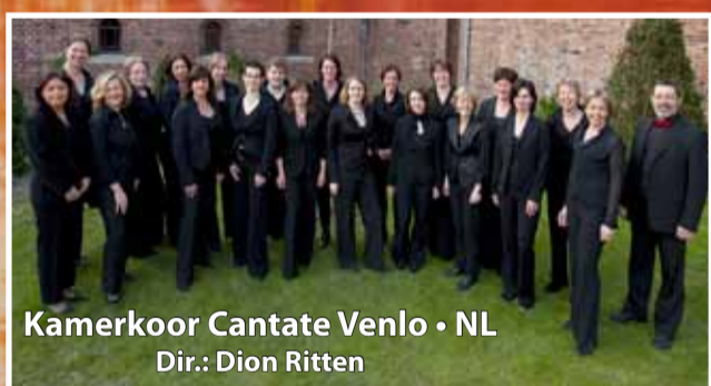
Kamerkoor Cantate Venlo • NL Dir.: Dion Ritten