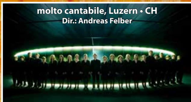
molto cantabile, Luzern • CH Dir.: Andreas Felber