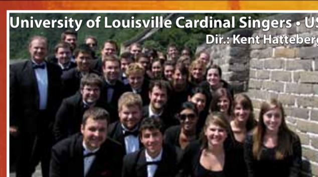
University of Louisville Cardinal Singers • US Dir.: Kent Hattberg